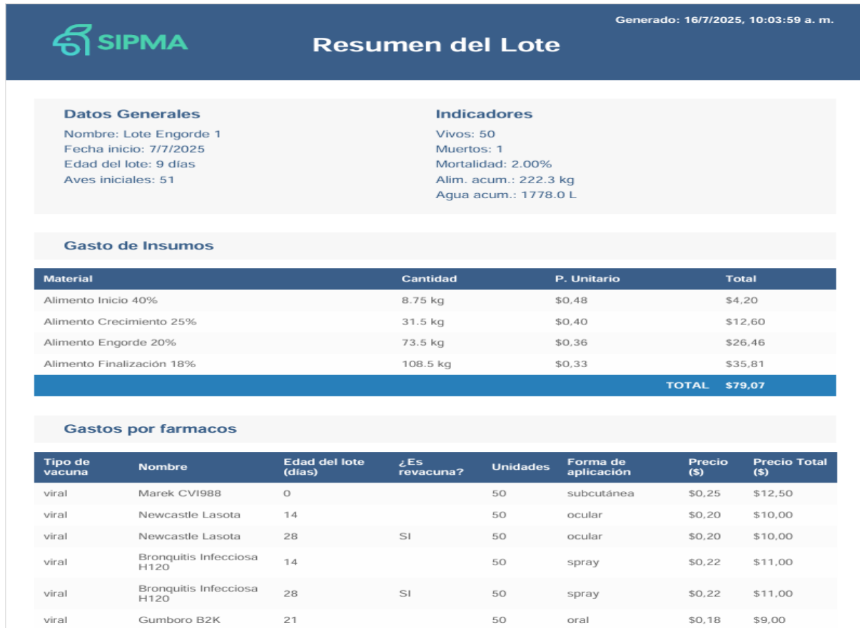
Figura 3. Resumen final del lote